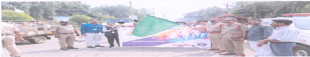
CI Ganesh flagging off Rashtriya Ekta Diwas rally of NSS volunteers in Rajamahendravaram on Monday

HANS NEWS SERVICE RAJAMAHENDRAVARAM (EAST GODAVARI DISTRICT)