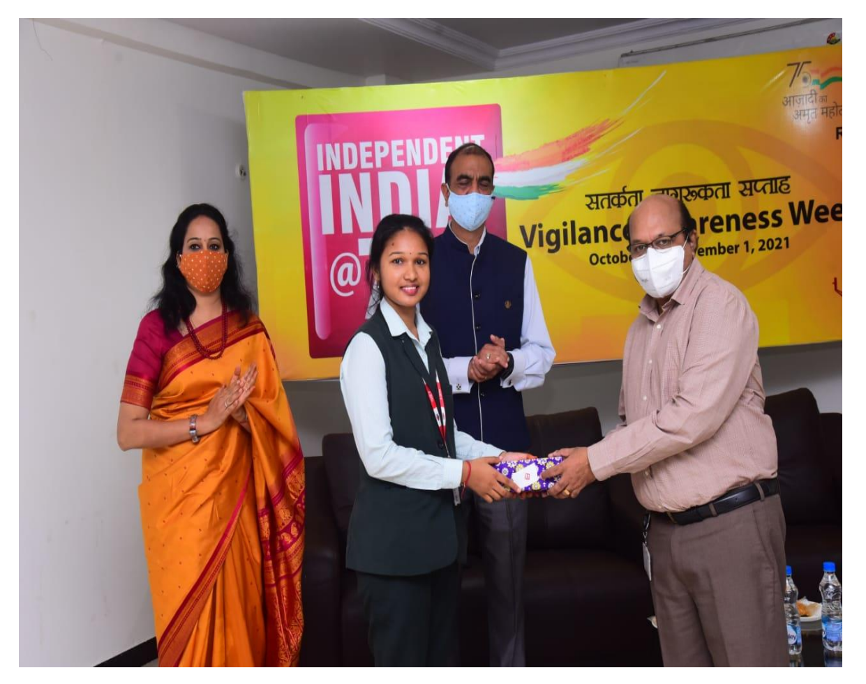
K.Lakshmi Lalithya Elocution (English) Winner